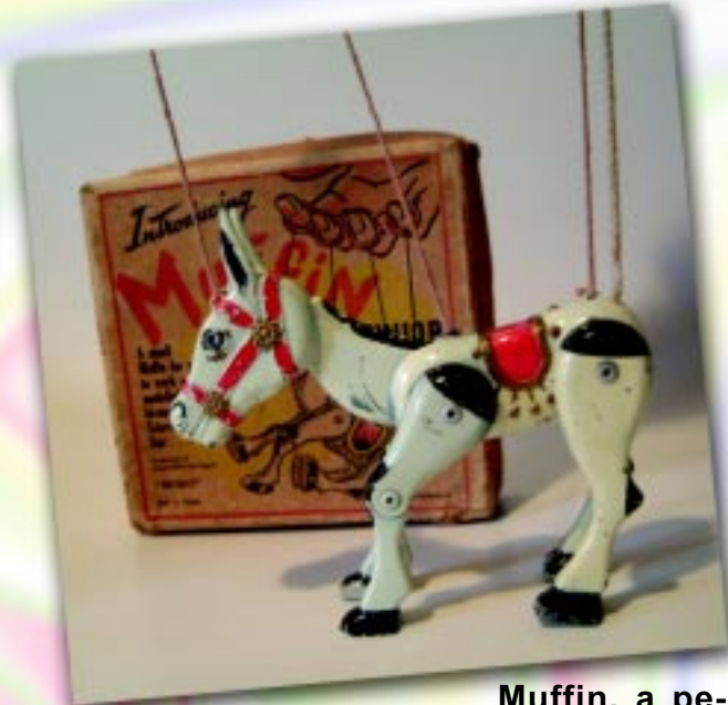
Muffin, a pequena mula de metal - um dos primeiros lançamentos

A série Major Pack , produzida até 1966, era compatível com a escala 1/64, tratores, caminhão