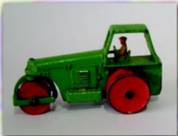
O compactador dos primeiros lançamentos