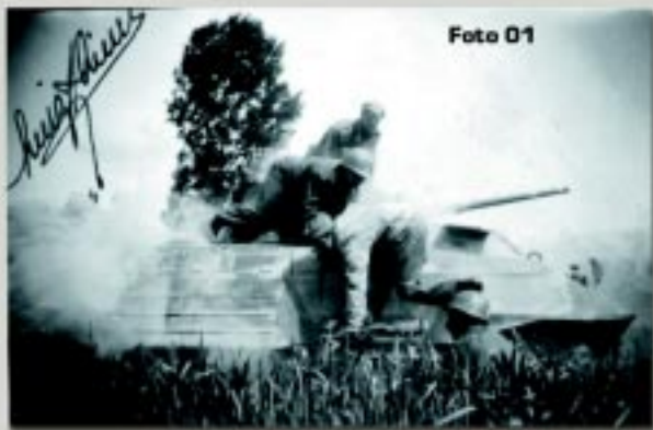
Treinamento de evacuação de um M-8 em chamas na Itália em 1944. Isto se tornou real algum tempo depois.