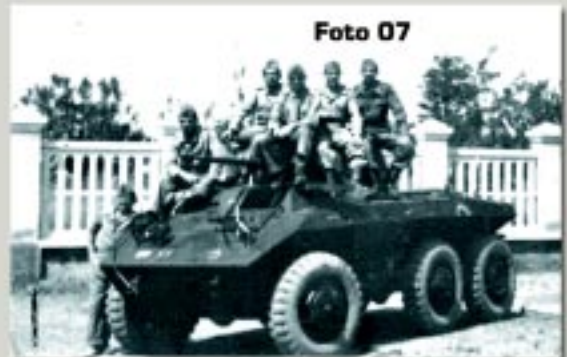
Acima: M-8 do 1º Esq. Rec. na Itália. Notar a falta da saias laterais, os emblemas frontais e o pedaço do emblema lateral entre as duas rodas traseiras. [Museu do 1º Esq. Cav. Mec. Valença - RJ]

Nenhum dos veículos empregados pela FEB foram oriundos do Exército Brasileiro, mas sim recebidos na Itália, pois o Esquadrão teve apenas uma semana para se familiarizar com os M-8 que iria empregar ao longo da guerra, o mesmo ocorrendo com os outros veículos nas outras unidades, onde alguns soldados