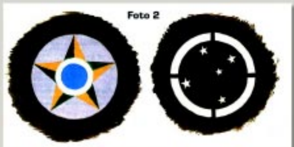
Emblemas usados nos veículos do Exército Brasileiro, no Brasil à esquerda e na Itália à direita. [Desenho Newton Barbosa de Castro. Coleção do autor]