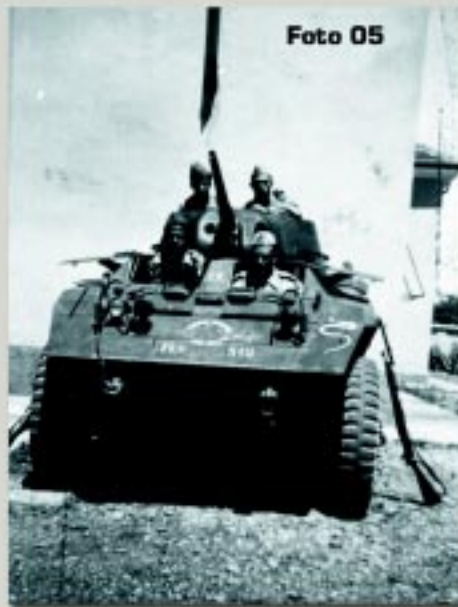
À direita: O Leão do Norte. Notar as matrículas na frente do veículo e no nome na lateral. [Museu do 1º Esq. Cav. Mec. Valença – RJ]