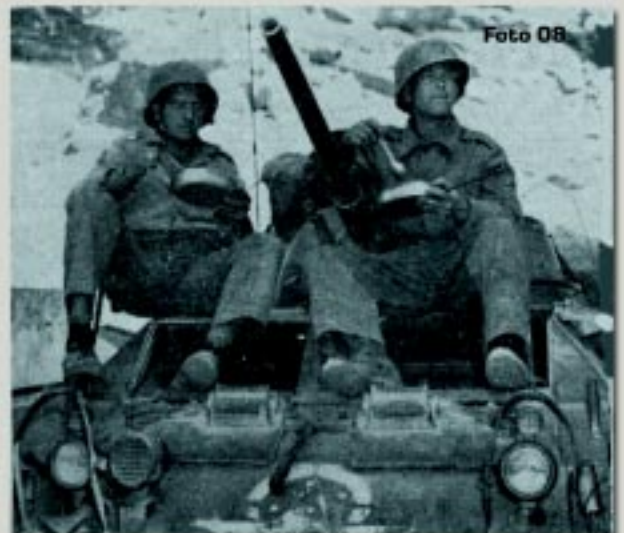
À Direita: Uma pausa para o almoço. Notar o emblema brasileiro sobre o americano.