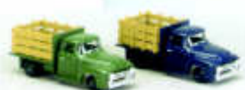
Caminhões 2 peças (LIFE 1618)