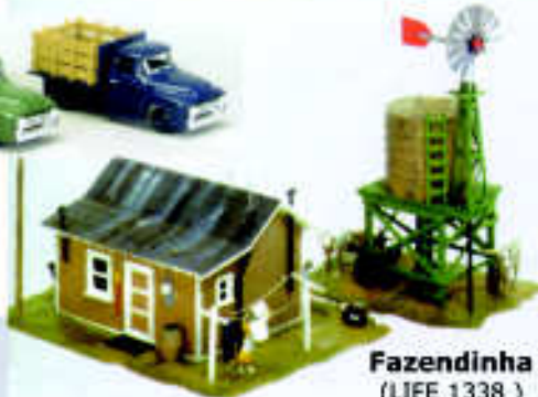
Fazendinha (LIFE 1338)