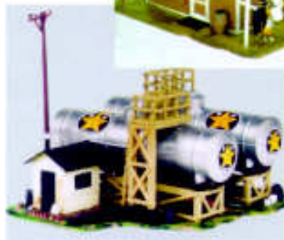
"National Oil Company" (LIFE 1331)